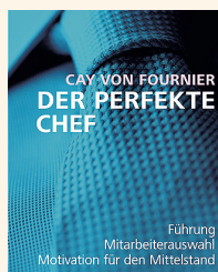
Der perfekte Chef Campus, 30,90 €

Der Schlüssel zu dauerhaftem Unternehmenserfolg ist und bleibt gute Führungsarbeit. Wie der „perfekte Chef“ Mitarbeiter in die richtige Richtung führt. Wie er sie dafür begeistert, Ziele zu erreichen. Wie er sie wertschätzt und das auch zeigt. Und wie er die richtige Balance aus Menschenführung und Kostenmanagement findet, steht in diesem Buch. An sich nichts Neues – lesenswert ist das aber allemal. (gul)