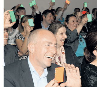
Schwarmintelligenz während Flugsimulation